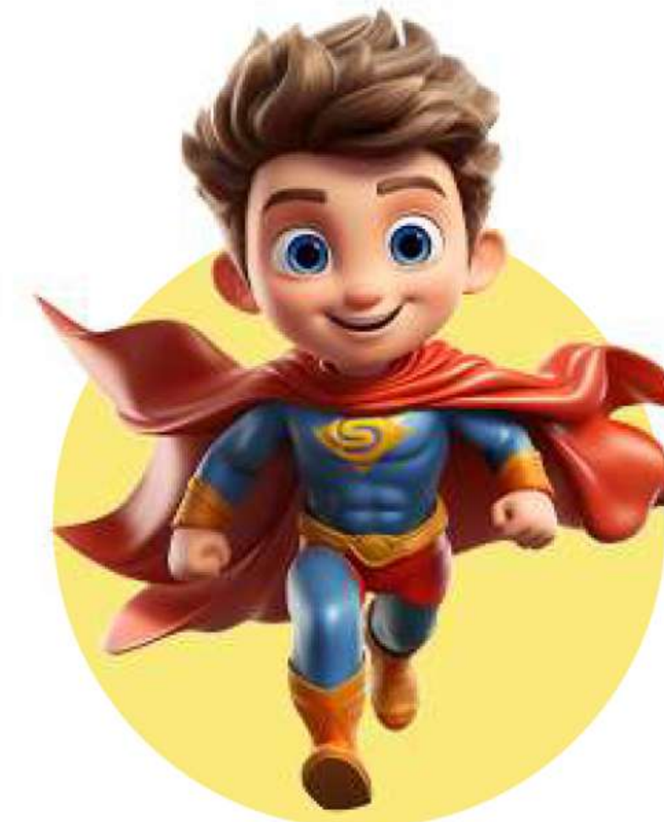
Телевизионни и радио коментатори на книги