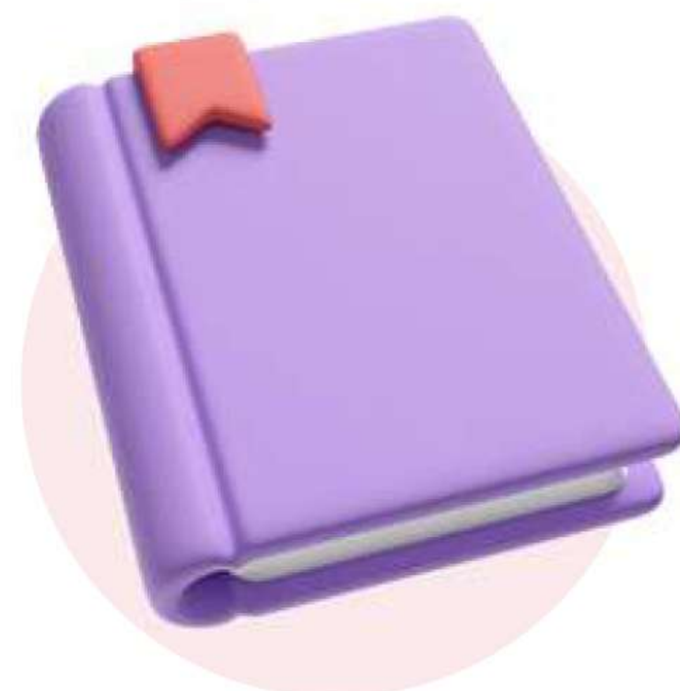
Енциклопедии (вкл. Уикипедия)