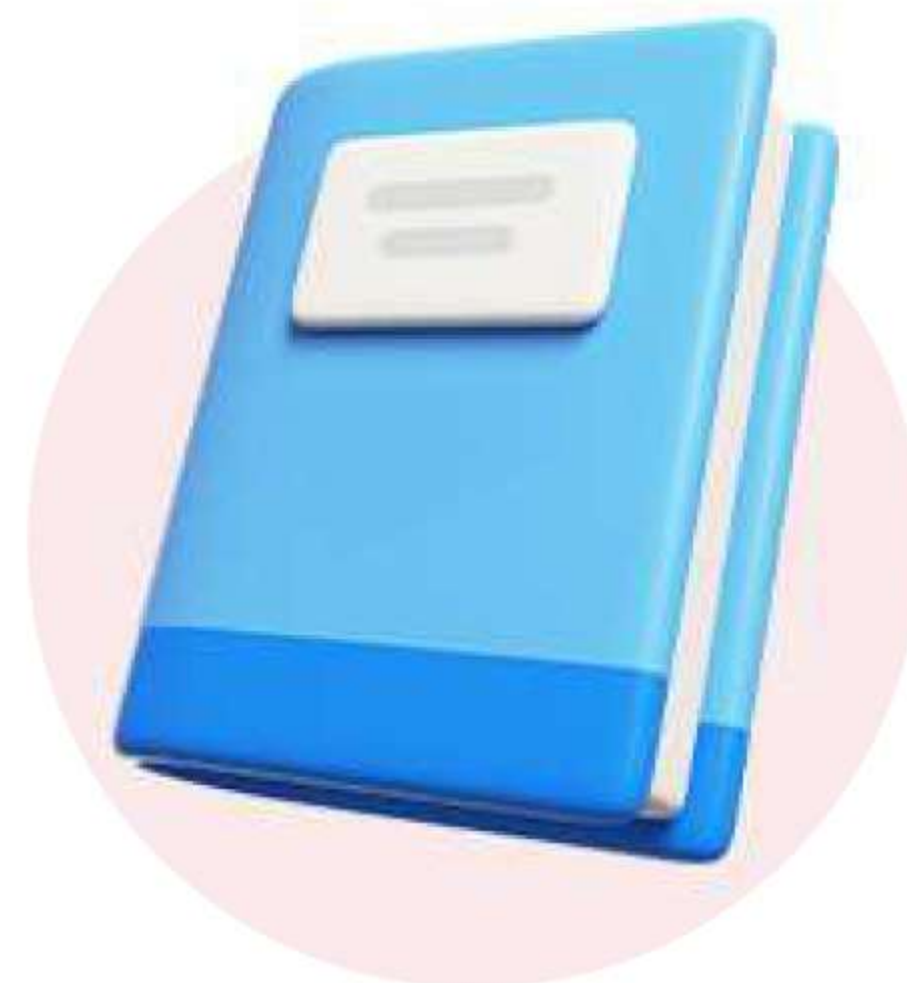
Книги (хартиени и електронни)