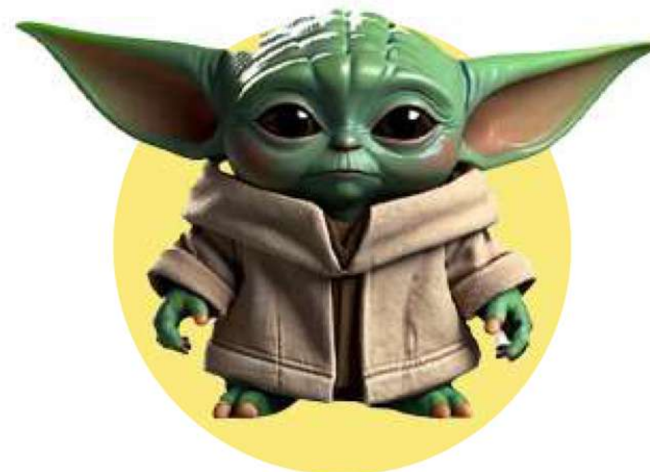
Директори на големи издателства