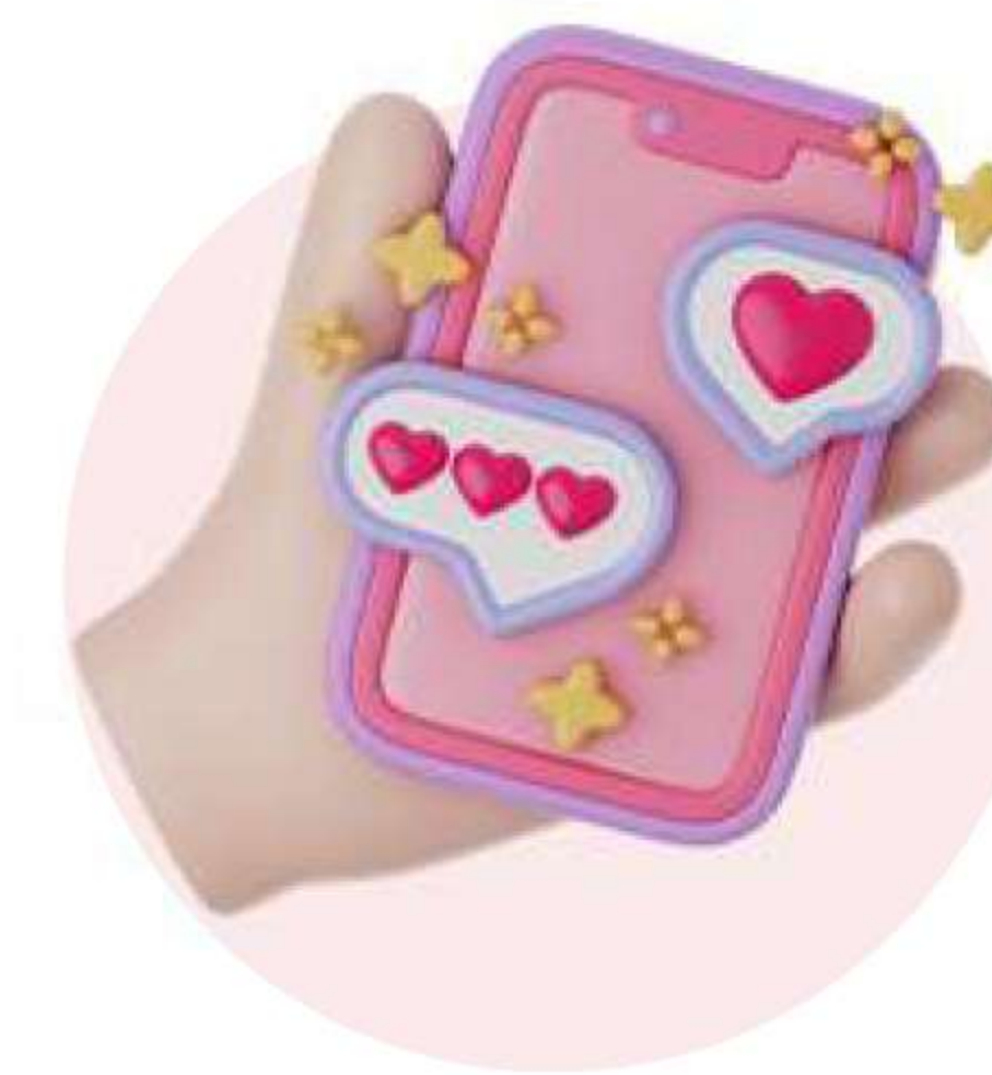
Акаунти в социални мрежи