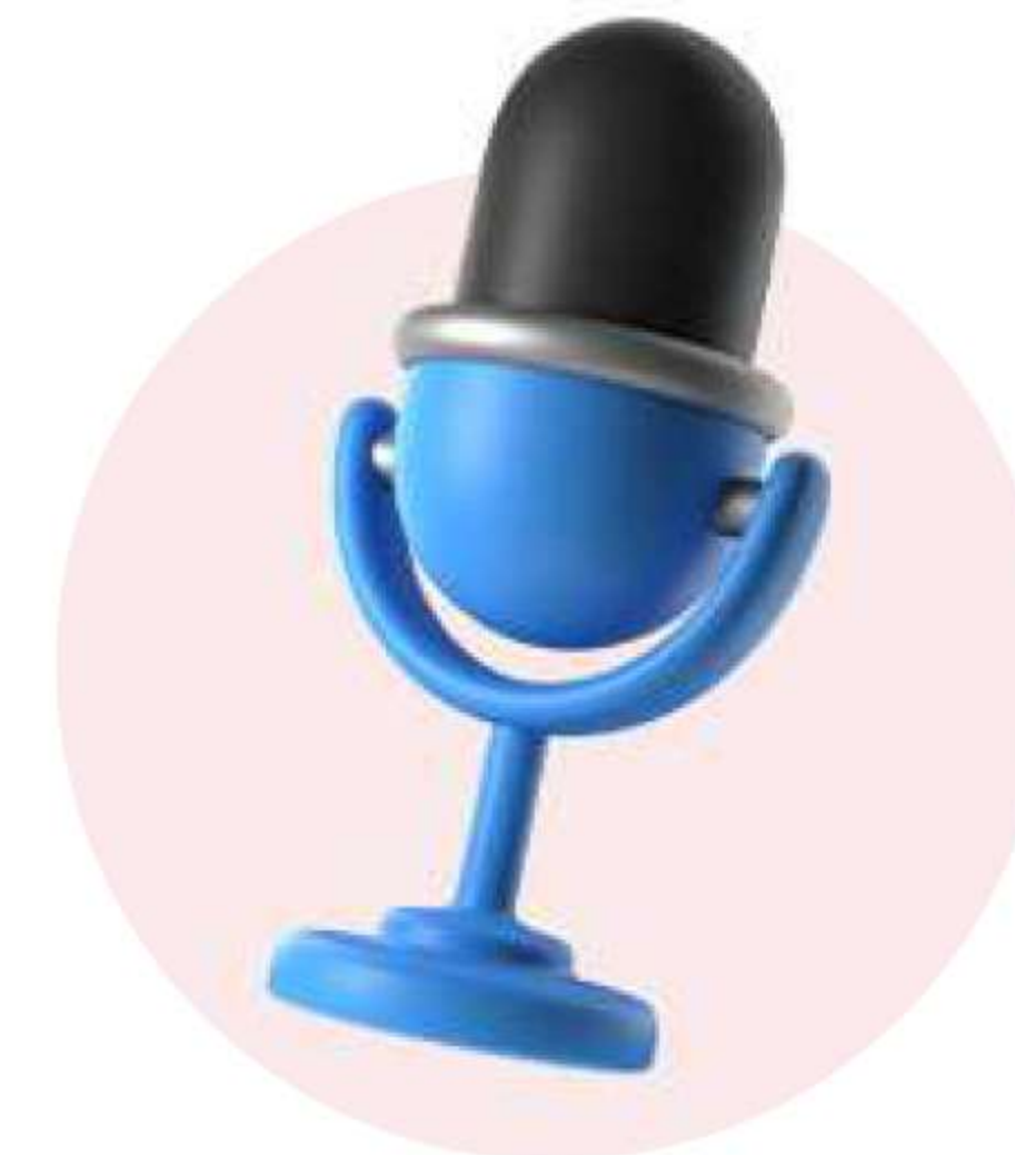
Периодика (хартиени и дигитални медии: вестници, списания, подкасти и пр.)