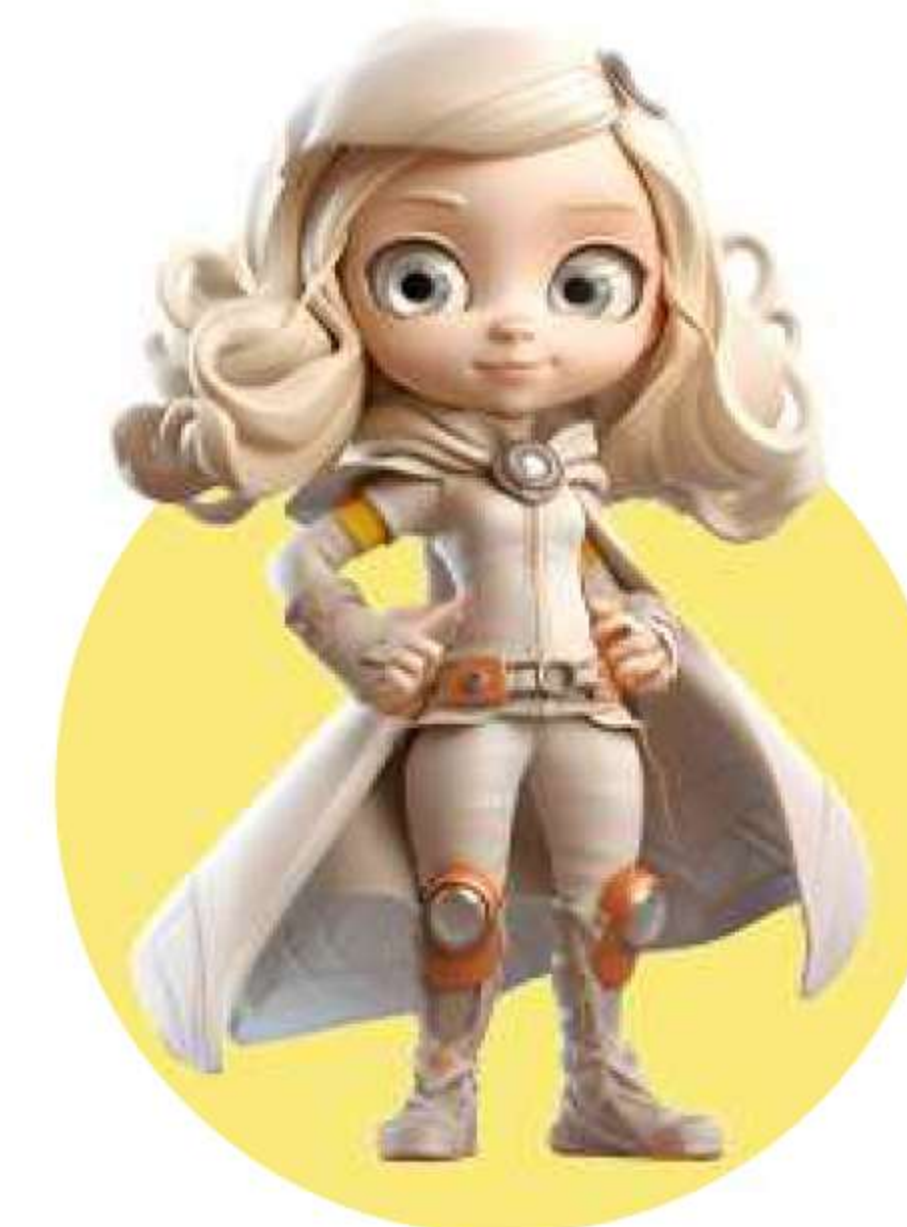
Журналисти в традиционни и дигитални медии