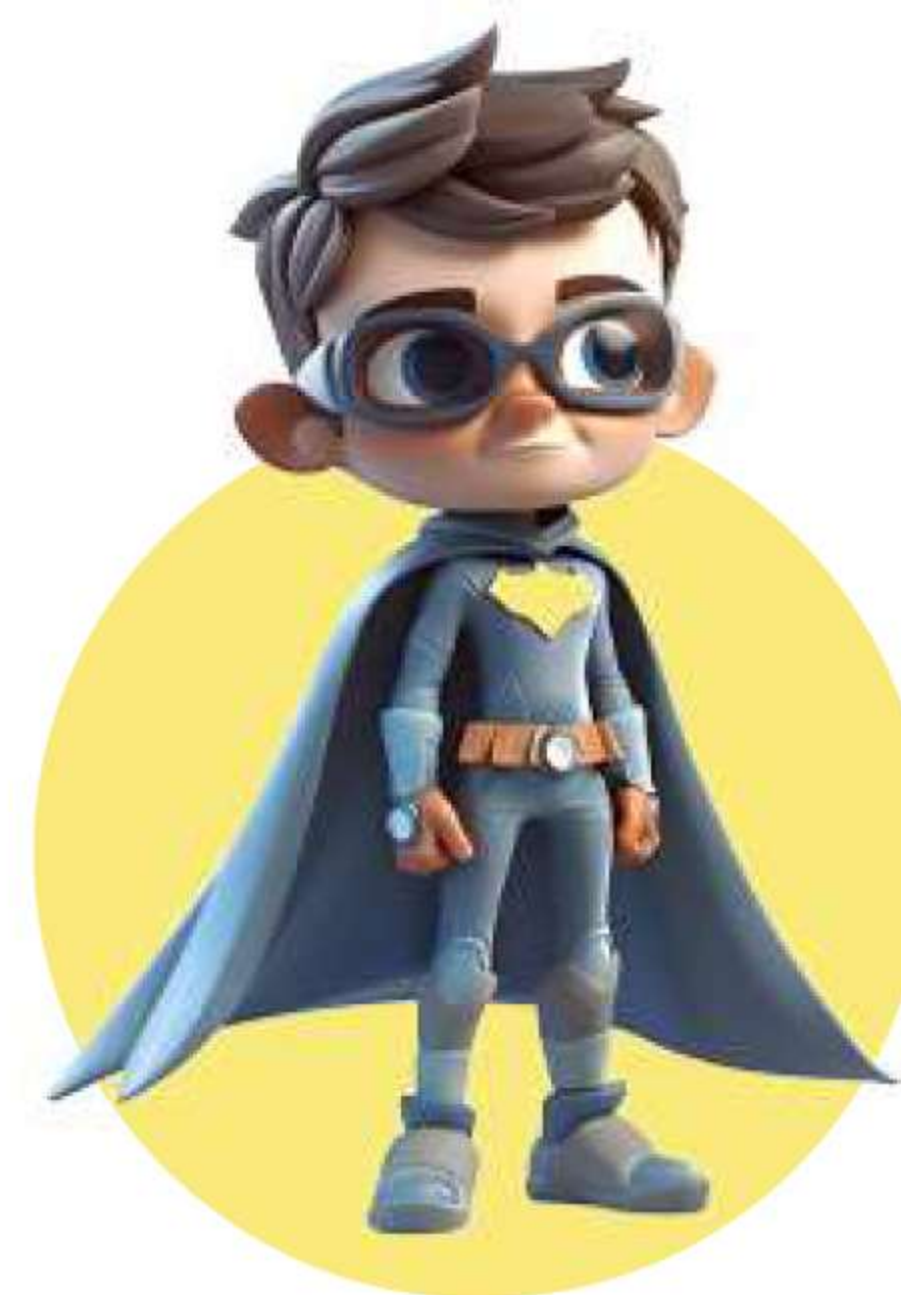
Юристи, специализирали авторско право